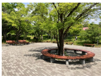
サークルベンチ 2 台

キャンパスではサークルベンチで談笑する学生の姿が見られ、またウォーターサーバーは日々勉学に励む学生に利用されるなど、これらの寄贈品は学生生活の快適さと充実に大きく貢献しています。