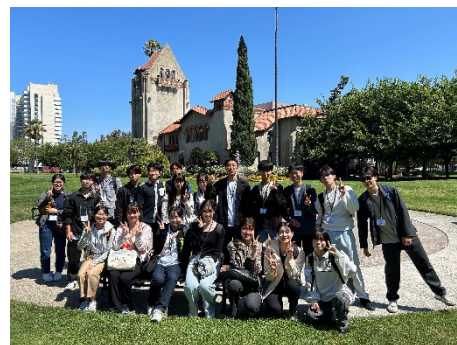
サンノゼ州立大学にて

起業や資金調達を意識した実践的な発表は、今後社会で活躍する学生にとって大変貴重な経験となりました。後援会からも渡航費用の一部を支援し、学生の学びの向上に寄与しました。