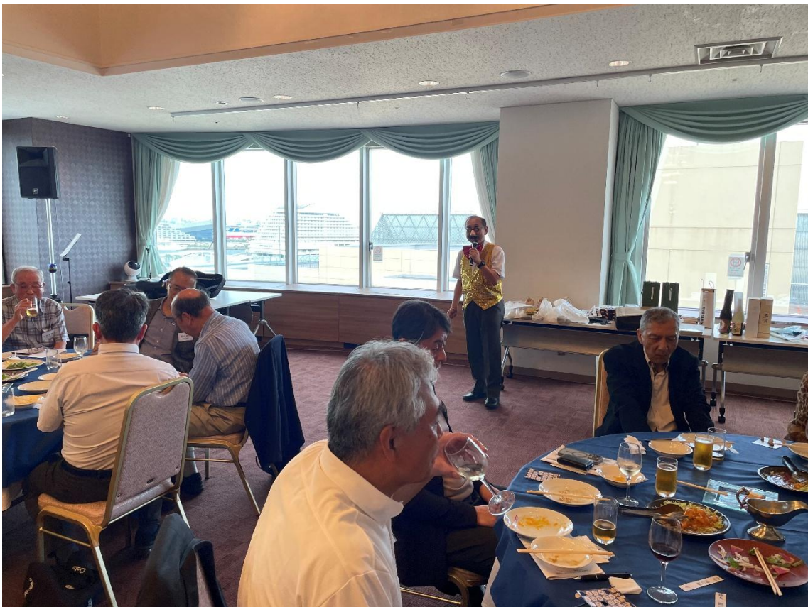
⑫ ビンゴ大会 スタート