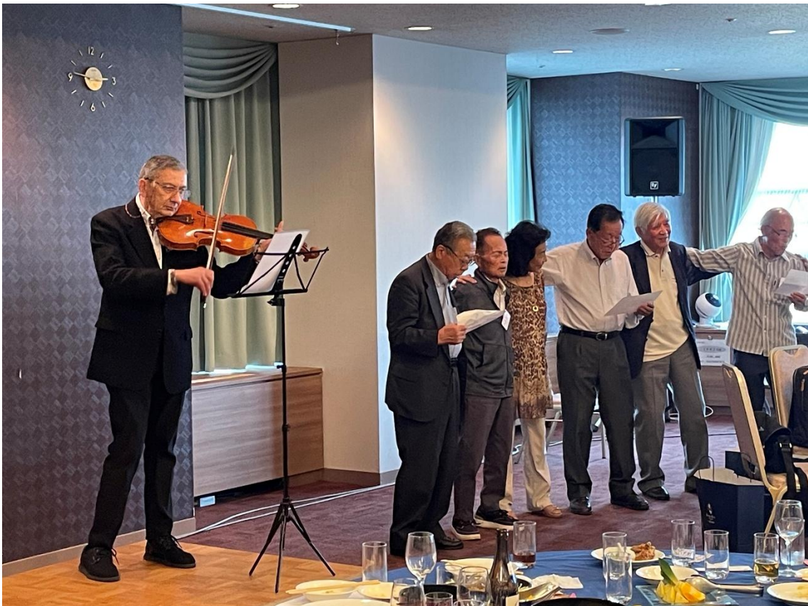
⑭ 全員で高商校歌 合唱