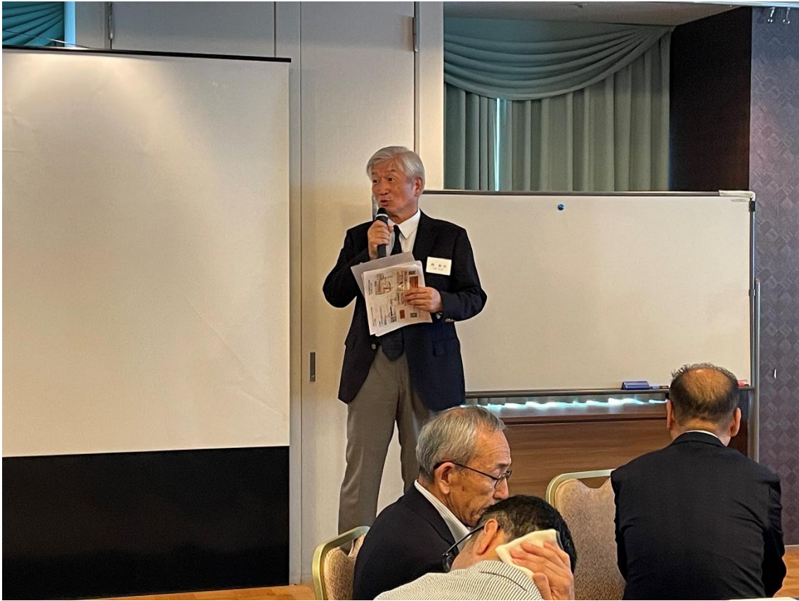
① 伴兵庫支部長挨拶