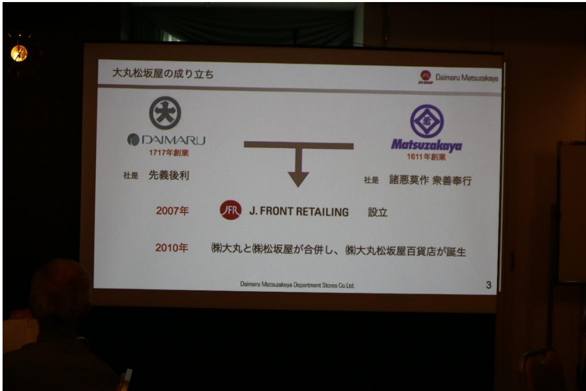
⑤ 記念講演 資料