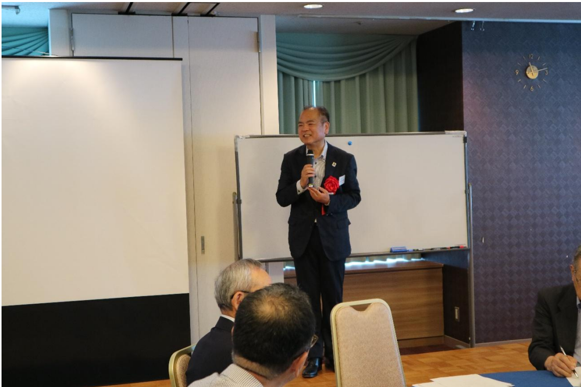
② 小倉副学長 ご挨拶