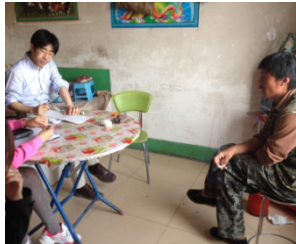
画像2 家計調査の様子

そこで、中国内モンゴル自治区において、生態移民を実施した牧畜民の村を対象に、複数年にわたる継続的な家計調査を大学院生と共同で行っ