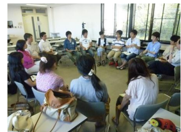
ゲストを囲んで、車座談義

東日本大震災から1年。東北の被災地のために、滋賀にいる私たちに何ができるのか、多彩なゲストの話聞きながら考える「被災地応援プロジェクト2012夏」を5日間集中講義として実施しました。授業は、ゲストを招いての講義とダイアログ（対話）をメインに、被災地への思いなどを確認する初日のオリエンテーションと、今後のアクションプランを考える最終日のワークショップという3部構成。