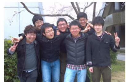
喜びの受賞したメンバー