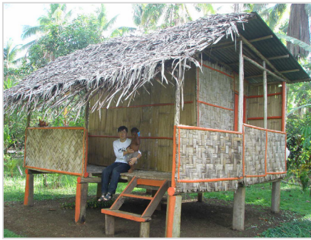
パプアニューギニアの自宅 (電気ガス水道なし)にて

2012年4月に社会システム学科に着任しました。私の専門は言語学という分野です。言語学を専門とする大学の研究室では、卒業論文の執筆で何かひとつ言語を選び、その言語に