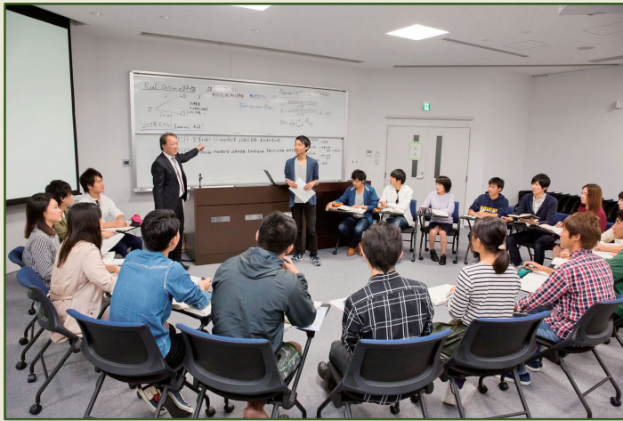
財務経理の専門性を極め、チームワークとグローバルな問題意識を養い、世界で通用するファンダメンタルズを鍛えるゼミナール