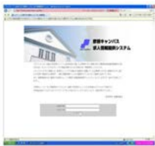
求人情報提供システム