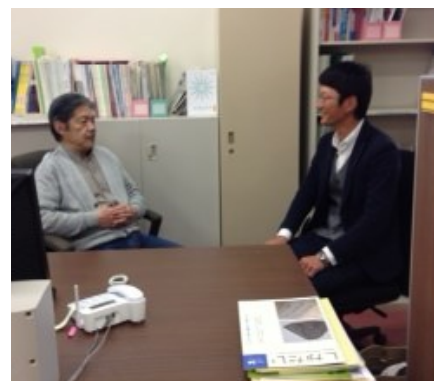
就職支援室での相談風景