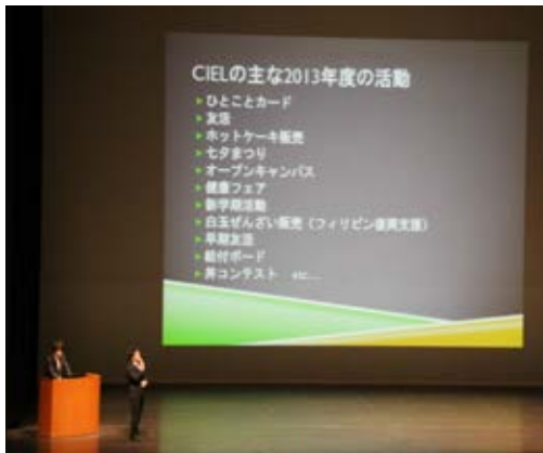
入学式後オリエンテーションでの成果発表

募集を行っている学生自主企画プロジェクトにおいて、経済学部、教育学部からそれぞれ1団体(合計2団体)が優秀団体に選ばれました。 経済学部からは、『CIELプロジェクト』が優秀団体に選ばれました。CIELとは生協の学生委員会であり、①生協の運営に組合員の声を届ける、②学生として、組合員の一人として、組合員同士や組合員と生協をつなぐ架け橋となる、③組合員同士の同じ目線で悩みや不安を考え、組合員と共に「充実した大学生活」を目指す、ことを目的としていろいろな活動(取り組み)を行っています。新入生企画、七夕まつり、健康フェア等々、新入生、在学生、あるいは教職員からも好評で、地域の方々との交流も大切に活動を行っています。 この優秀団体2団体が、今年度の