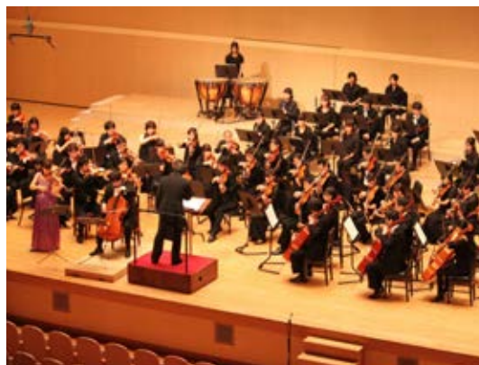
公開定期演奏会 (ひこね文化プラザ)

経済学部オーケストラ部が公開定期演奏会を開催し、今回で30周年となった。演奏会には、約1000名