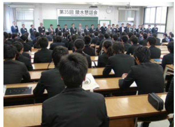
第35回 陵水懇話会開会式

一度きりしかない自分自身の人生にはいろいろな生き方があり、働き方があると思います。本学部の学生の